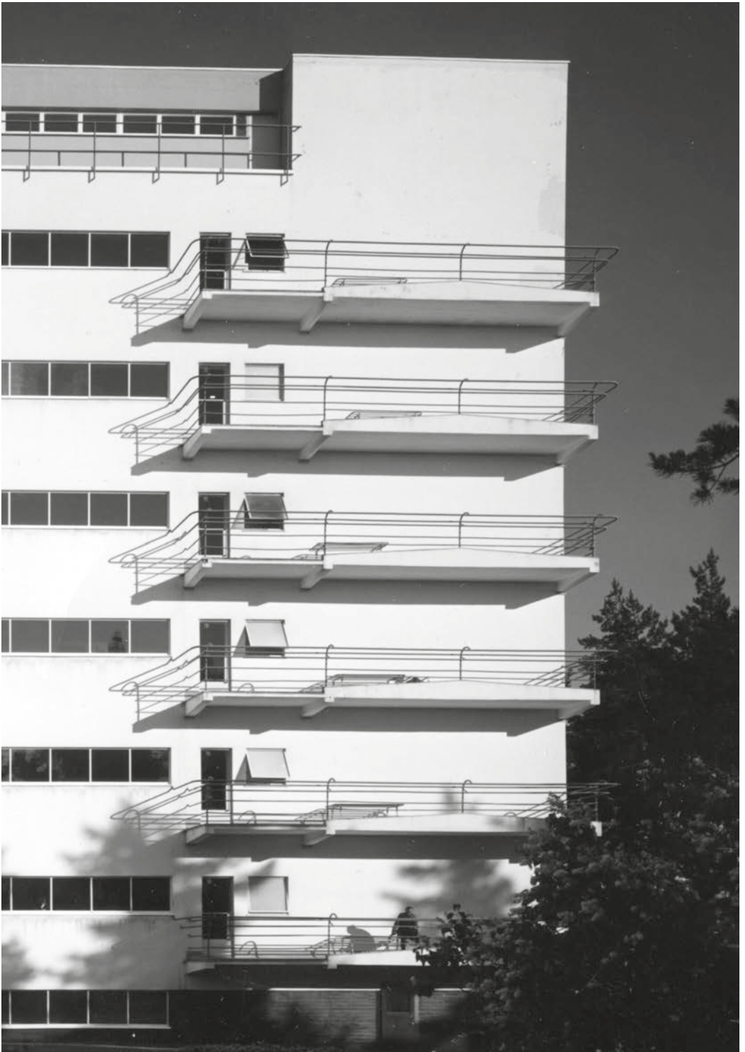
Monet merkittävimmistä Artekin tuotteista suunniteltiin Turun lähistöllä sijaitsevaan Paimion parantolaan (1928-33). Aino ja Alvar Aalto halusivat kalusteiden ja sisustusten olevan kauniita ja näin lisäävän potilaiden hyvinvointia.