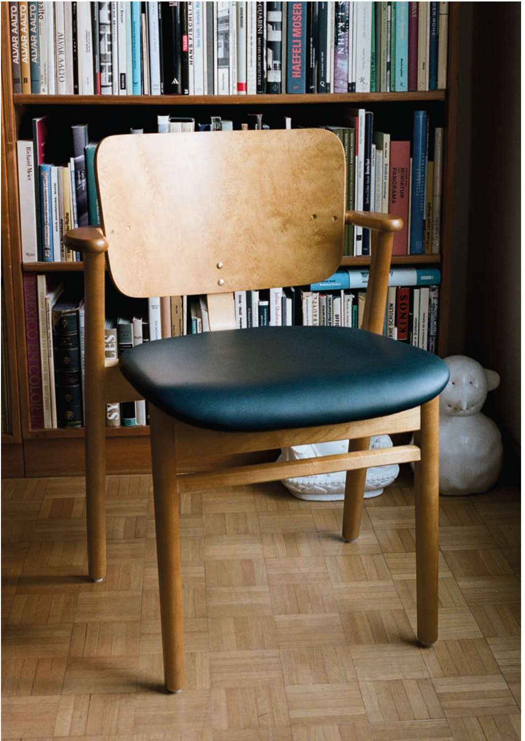
Domus Suomi 100 -tuolin pehmeässä poronnahassa näkyvät eläimen elämän kaikki jäljet. Vuosien varrella se patinoituu kauniisti.