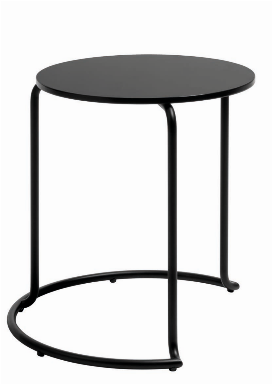
Sivupöytä 606, jonka Aino Aalto suunnitteli Paimion parantolaan (1928-33) kenkien riisumista helpottavaksi jakkaraksi, on löytänyt monia muita käyttötarkoituksia kodeissa.