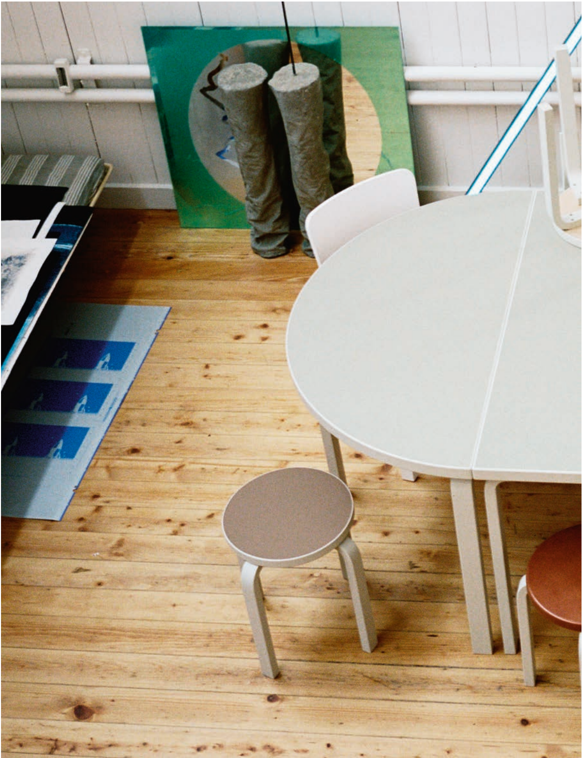
Klassiset Aalto-tuolit ja -jakkarat näyttävät raikkailta kivenvalkoisessa värissä ja neljällä uudella linoleumisävyllä päällystettyinä.